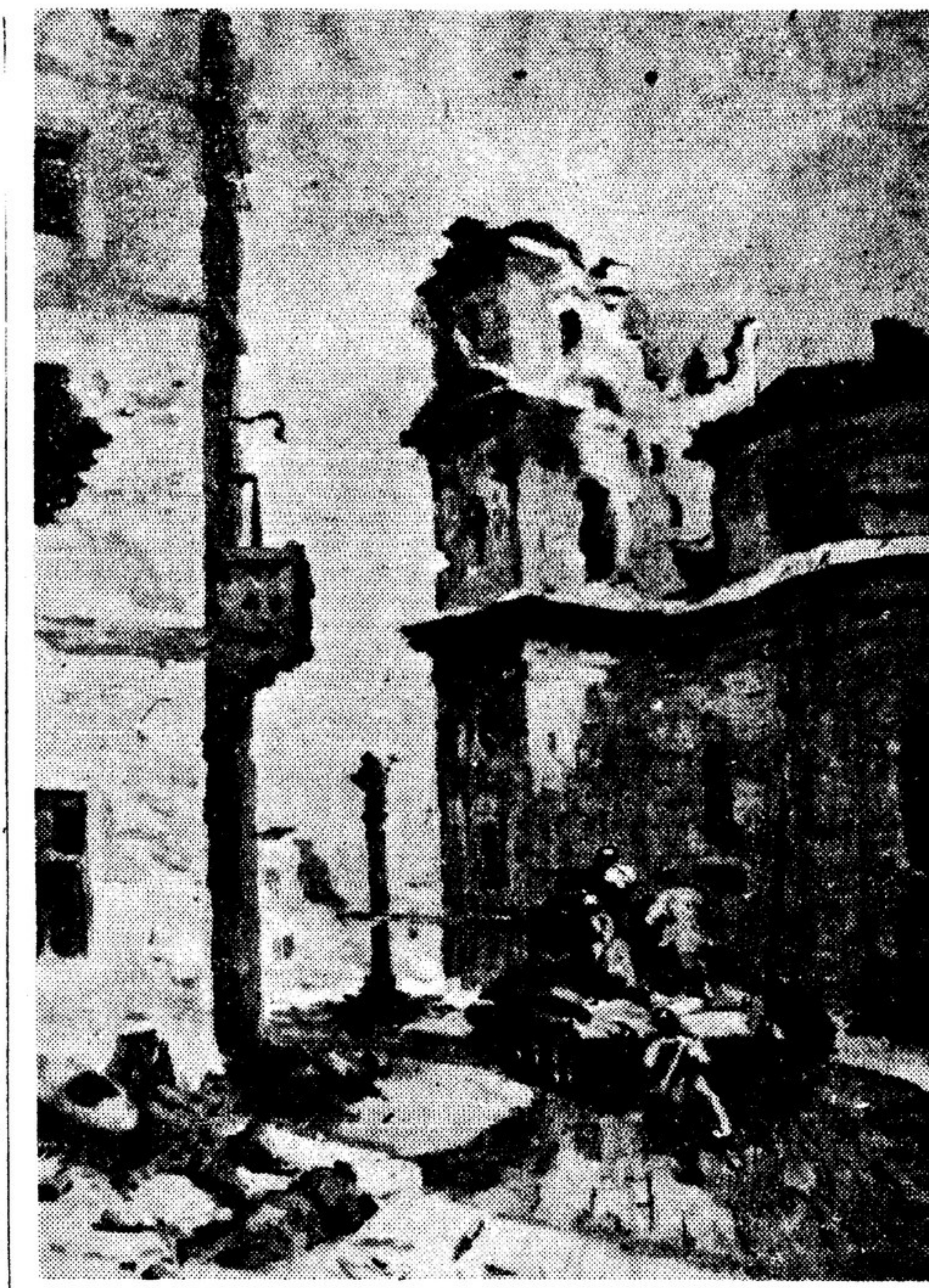
Советские танкисты врываются в город, освобожденный от немцев. Из фронтального альбома Ф. ПОПОВА. Тиражность 1944 г.

Крупнейший наш фольклорный коллектив — мужской хор под руководством Ю. Варисте, подготовил большую программу из произведений эстонских композиторов, созданных своего нового. Заслуженный деятель искусств Г. Эрнесакс, композиторы Х. Леннур, Э. Арро написали свыше 60 произведений для хора, Э. Канп — симфонию, сонату для скрипки, ряд пьес для двух роялей.