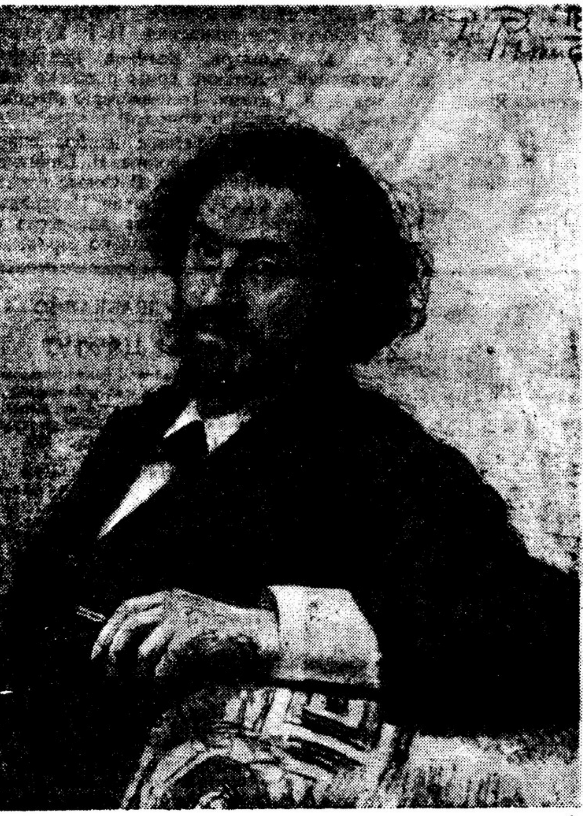
И. Е. Репин. Автопортрет. Уголь. 1899 г.